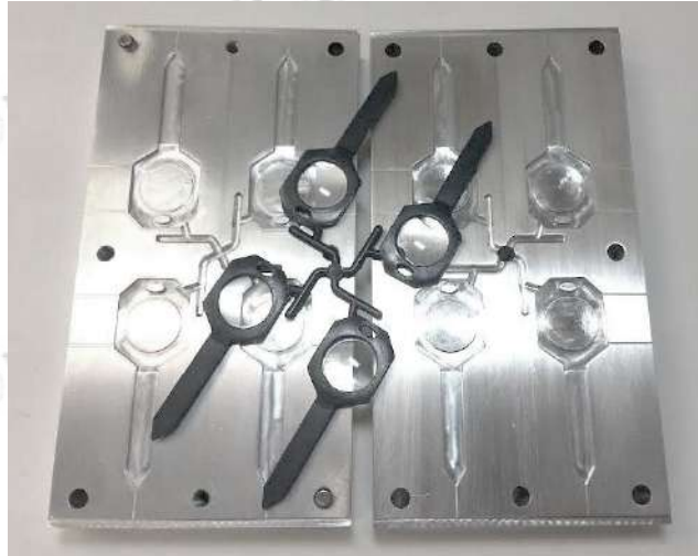
Figure Q2 (b) / Gambarajah S2 (b)