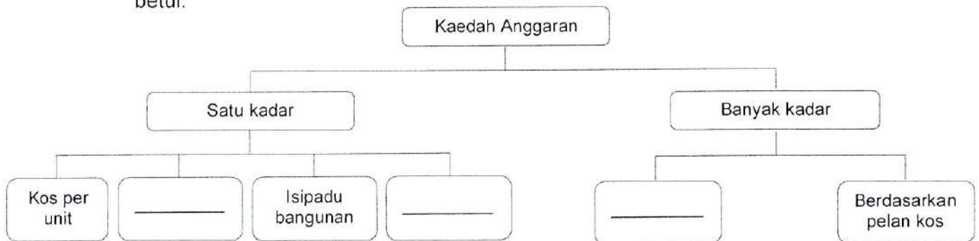
Rajah 2: Kaedah anggaran kos bangunan