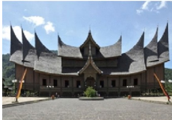
Soalan 6 berdasarkan Gambarajah A

6. Bentuk bumbung gambarajah A diinspirasi daripada