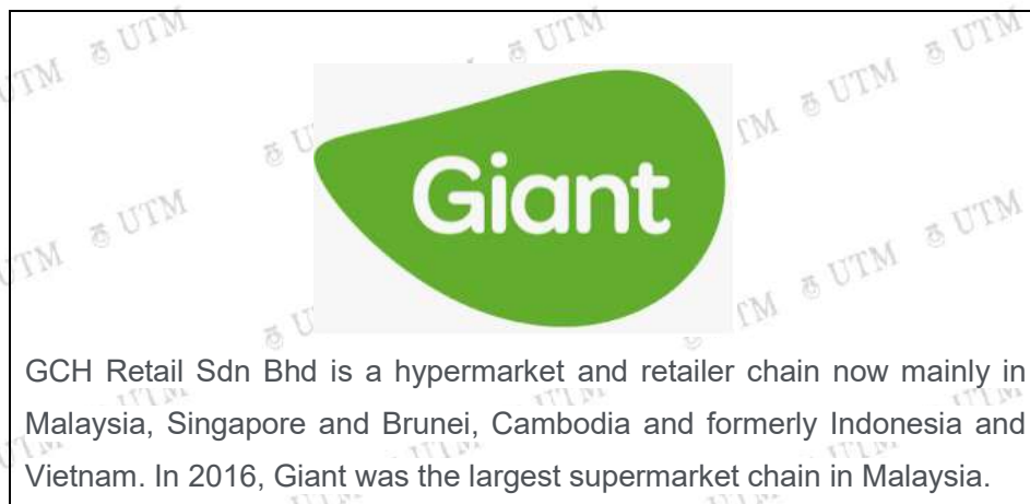
Figure 1 : GCH Retail / Rajah 1 : GCH Retail

Based on Figure 1, explain the business values of customer relationship management.