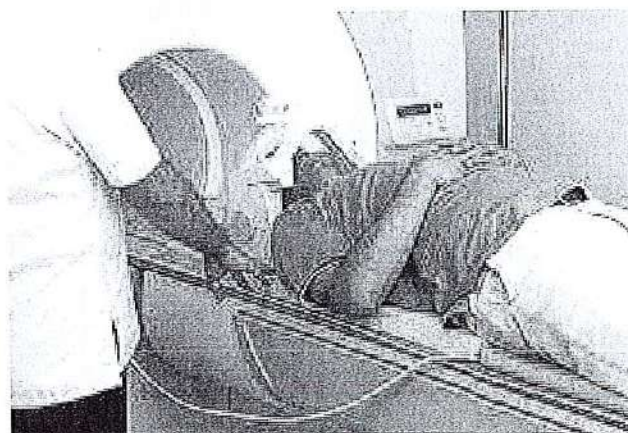
Figure 1 / Rajah 1