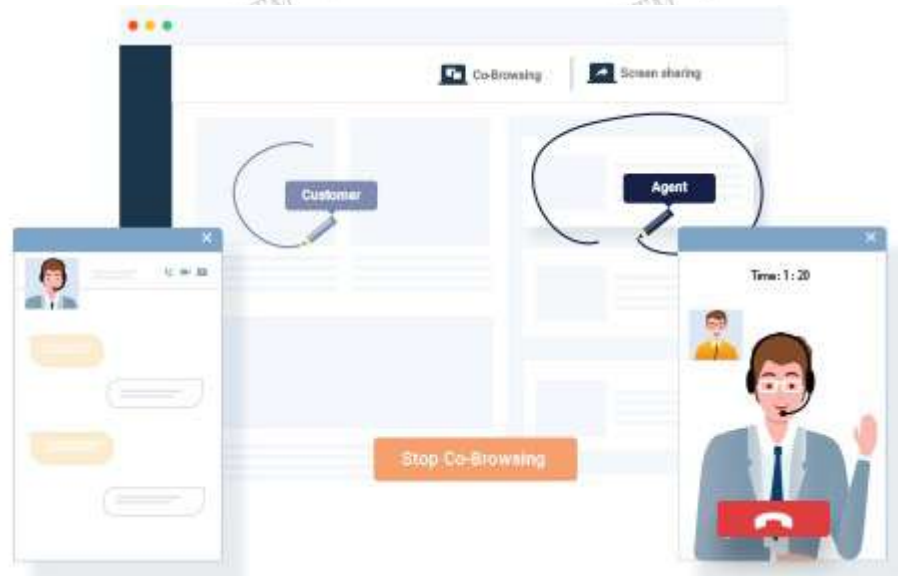
Diagram A / Rajah A

Jelaskan ciri-ciri bot perbualan sebagai aplikasi Pengurusan Hubungan Pelanggan (CRM). [6M]