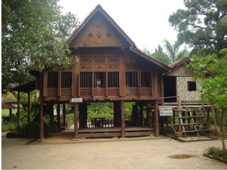
Soalan 1 berdasarkan Gambarajah B

a. Gambarajah B merupakan salah satu seni bina Malaysia.