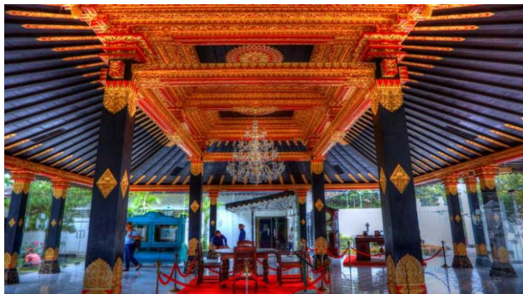
Soalan 6 berdasarkan Gambarajah A

6. Nama bangunan dalam gambarajah A diinspirasi daripada perkataan